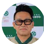
宮川 大輔 タレント