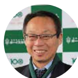
岡田 武史 FC今治オーナー 元 サッカー日本代表監督