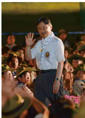
2018年、第17回日本スカウトジャンボリーにご来臨。第7回大会より欠かさずお越しになられ、スカウトにおことばを賜ってきました。