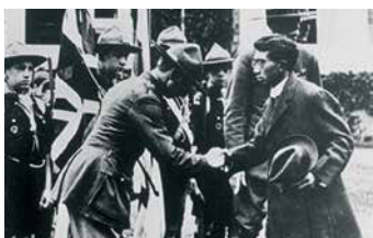
1921年、イギリスのボーイスカウトの大集会における昭和天皇(当時、皇太子)