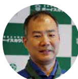
野口 聡一 JAXA宇宙飛行士

大和ハウス工業株式会社より寄贈を受け、2017年にグランドオープンした約82万坪の広大な野営場。指導者訓練のほか、地域社会と共生する施設として各種事業を展開。