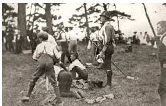
歴史的な実験キャンプ 1907年、創始者ロバート・ベーデン-パウエル卿がイギリスのブラウンシー島に20人の少年たちを集めて実験キャンプを行いました。これがボーイスカウト運動の始まりです。