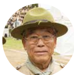
日枝 久 フジサンケイグループ代表