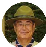
水野 正人 ミズノ株式会社相談役会長