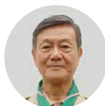
大坪 文雄 パナソニック株式会社特別顧問