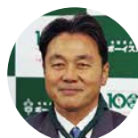
清宮 克幸 日本ラグビーフットボール協会副会長