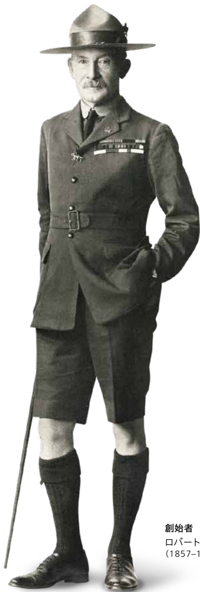
創始者 ロバート・ベーデン-パウエル卿 (1857-1941)