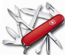
フィールドマスター